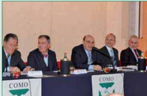
Tavolo dei relatori

Grande successo del convegno di presentazione dell'edizione 2008 del Borsino Immobiliare Città di Como e Provincia, l'annuale appuntamento che dal 1993 mette a confronto la Fimaa con la realtà imprenditoriale e politica comasca.