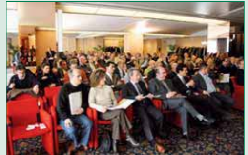
Sala del Grand Hotel di Como